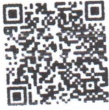
QR Code คู่มือบันทึกข้อมูล Plant for Good Report