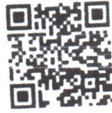
QR Code Dashboard Plant for Good Report