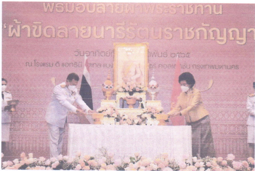
การจัดพิธีมอบลายผ้าพระราชทาน “ผ้าขิดลายนารัตนราชกัญญา” ระดับจังหวัด

ผู้ว่าราชการจังหวัด : มอบลายผ้าพระราชทาน “ผ้าขิดลายนารัตนราชกัญญา”